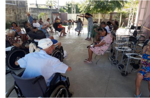
Atividade Física em Grupo