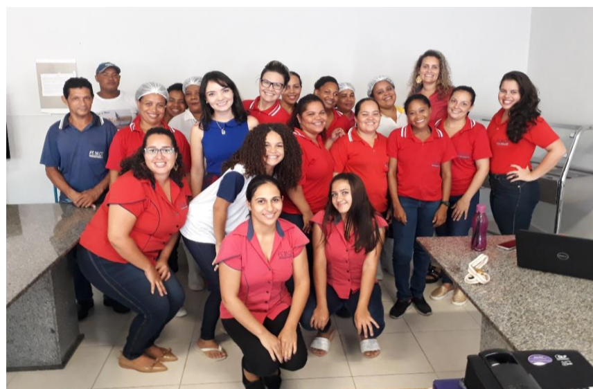
SEMANA DO TRABALHADOR