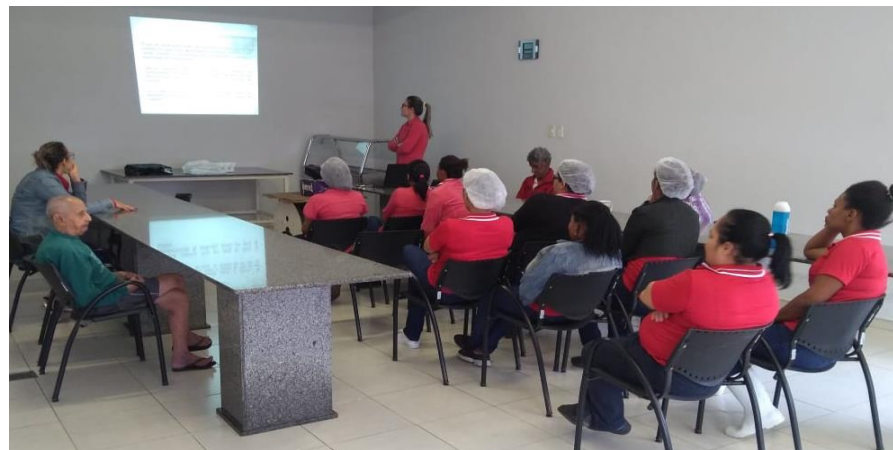
CAPACITAÇÃO DE FUNCIONÁRIOS