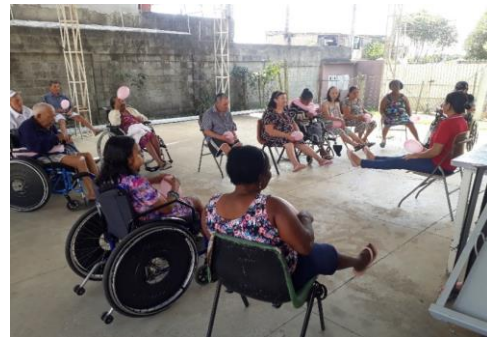
FISIOTERAPIA EM GRUPO