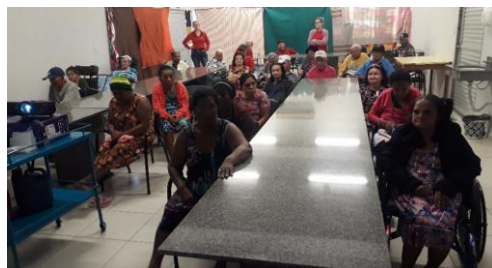
TARDE DE CINEMA