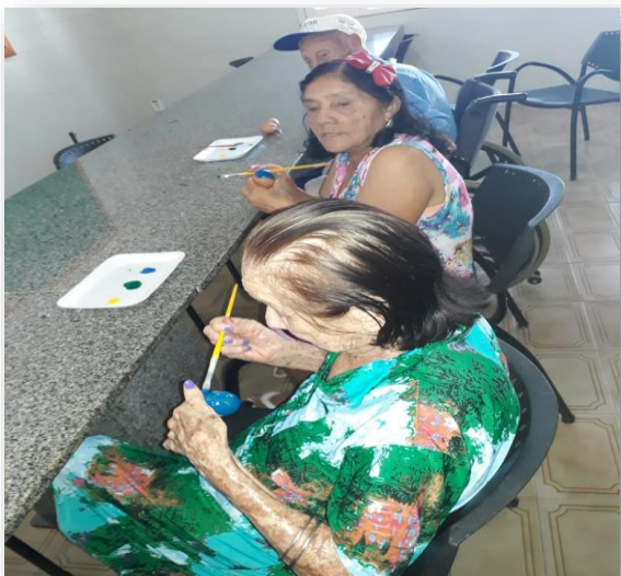
Atividade Recreativa com tema Pascoa