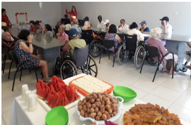
CAFE DIA DAS MAES