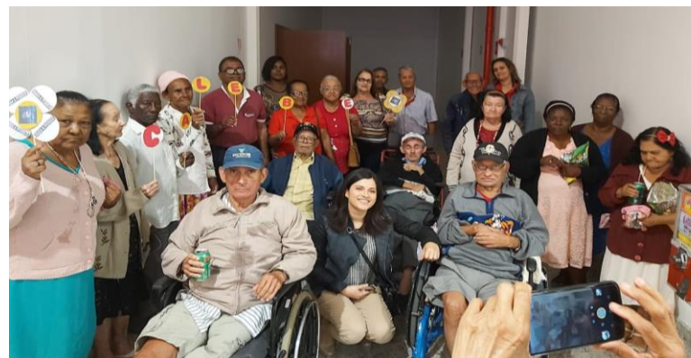
IDA AO CINEMA