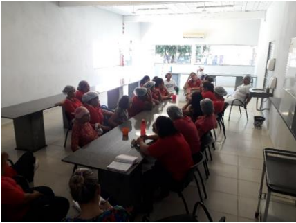
Roda de conversa com funcionários