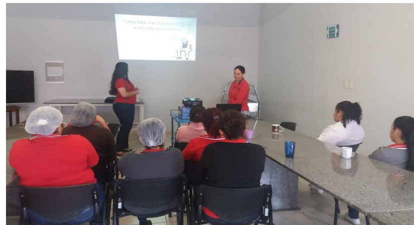
CAPACITAÇÃO DE FUNCIONÁRIOS