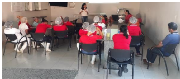
PALESTRA - IMPORTÂNCIA DA ATIVIDADE FÍSICA