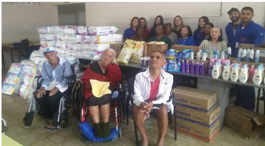
CAMPANHAS E DOAÇÕES