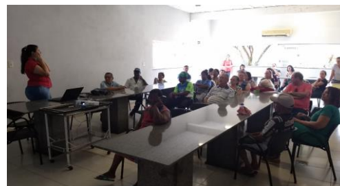
REUNIÃO COM FAMILIARES E AMIGOS