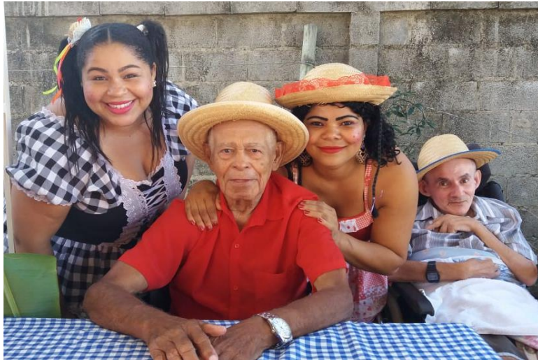
FESTA JUNINA COM FAMILIARES