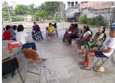
Atividade em grupo