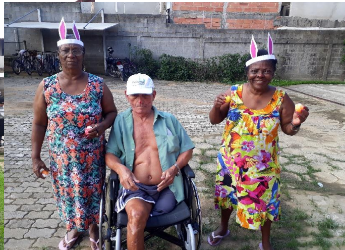
Caça aos ovos da Pascoa