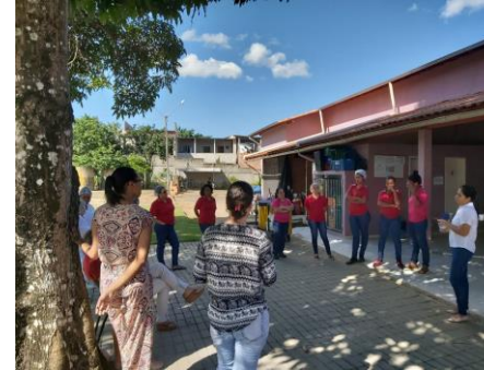
Laboral / Café Fim de Ano