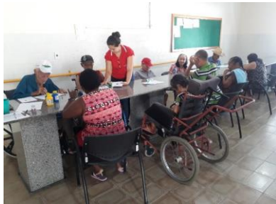
Atividade em grupo