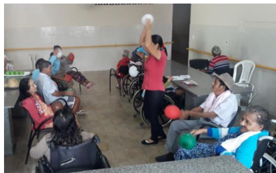
FISIOTERAPIA EM GRUPO