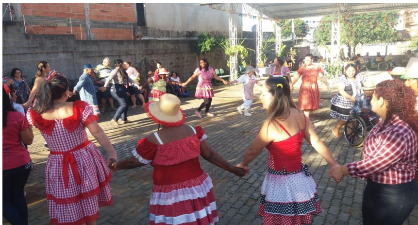
FESTA JUNINA COM FAMILIARES