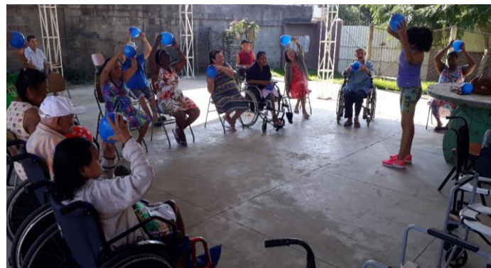
ATIVIDADE FÍSICA EM GRUPO