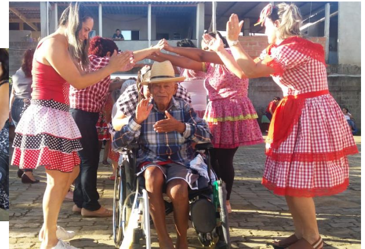
FESTA JUNINA COM FAMILIARES