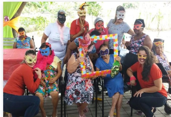
Comemoração do Carnaval Baile de Carnaval