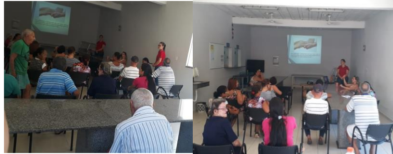
Reunião da família