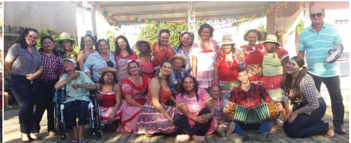
FESTA JUNINA COM FAMILIARES