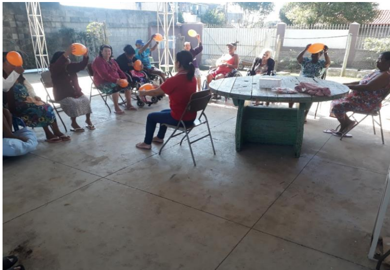
ATIVIDADE FISIOTERAPIA EM GRUPO