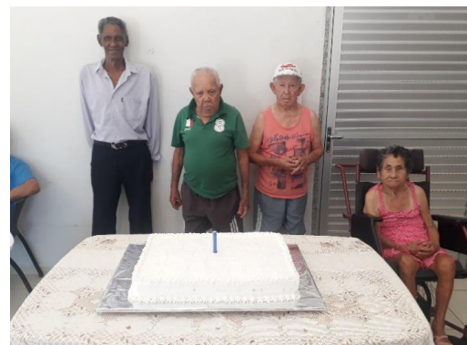
Aniversariantes do mês