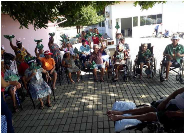
Comemoração da Pascoa