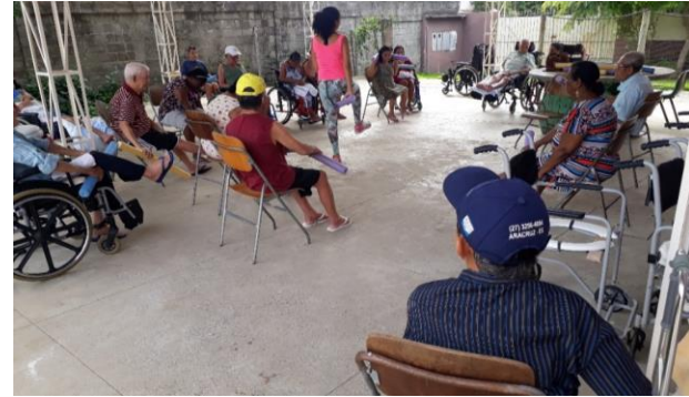
Atividade Fisica em Grupo