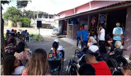
CAFÉ LIONS CLUB