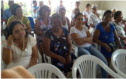
Confraternização Fim de Ano CCI