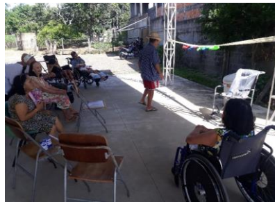
Atividade em grupo