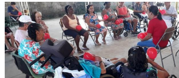
Fisioterapia em grupo