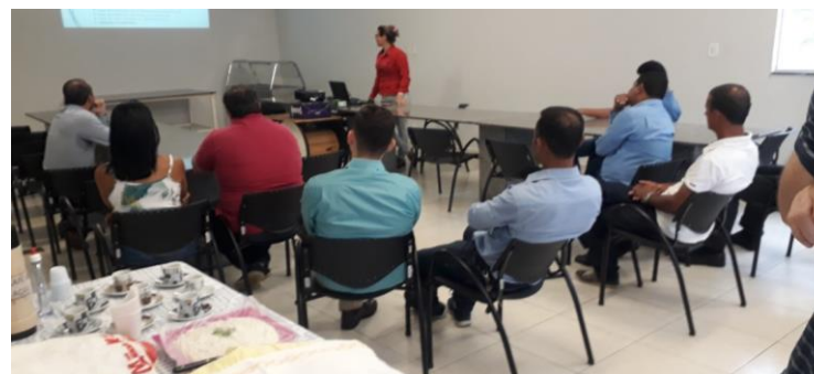
CAFÉ COM VEREADORES