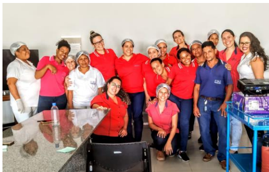
PALESTRA MOTIVACIONAL - AUTOESTIMA