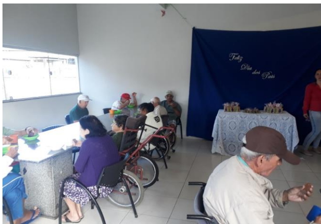
Confraternização Dia dos Pais