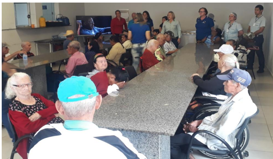
DIA DOS AVÓS