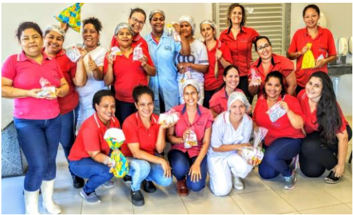
Laboral / Café Fim de Ano