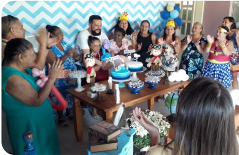
Comemoração de aniversário - externo