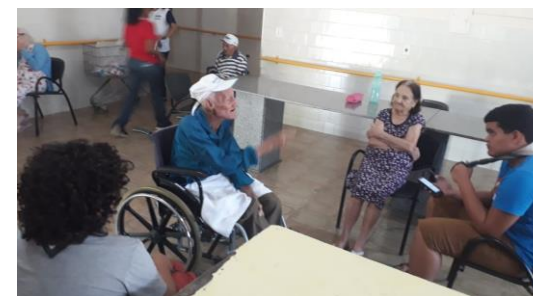
Projeto dos Escoteiros