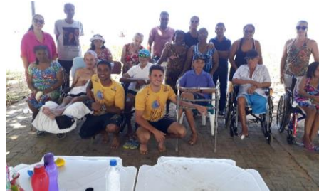
Passeio na praia - Projeto Nossa Praia