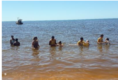
Passeio na praia