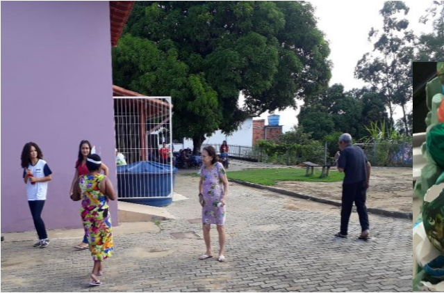
Caça aos ovos da Pascoa