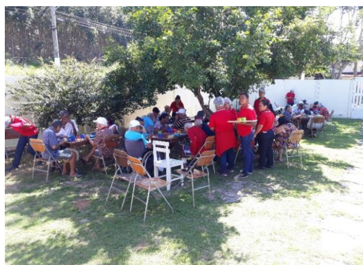
PASSEIO A PRAIA