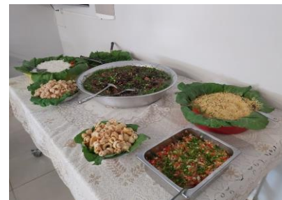
ALMOÇO ESPECIAL FEIJOADA